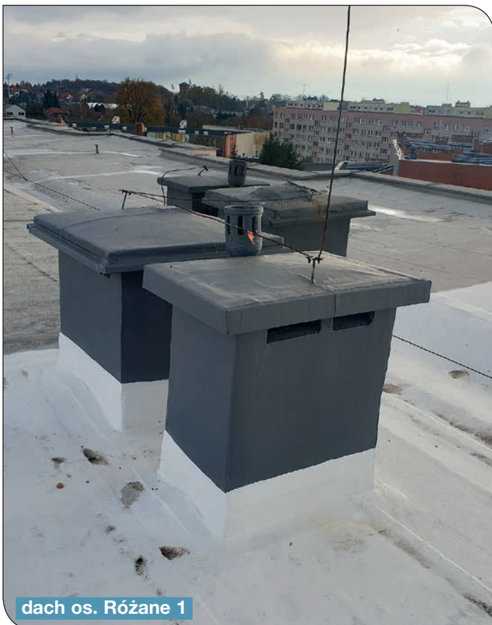
dach os. Różane 1