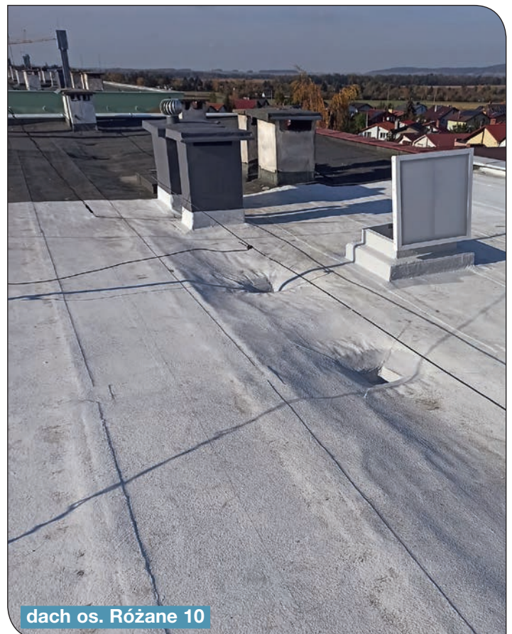
dach os. Różane 10